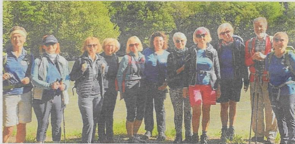
Gewandert wurde von Sachsenburg nach Spittal

Der Weg in Richtung Gleichberechtigung ist lang. Diese Symbolkraft tragen auch die „Frauen-GEHspräche“ des Soroptimist International Clubs. Der weltweit größte Serviceclub für Frauen ist auch in Oberkärnten verwurzelt. Zum 100-Jahr-Bestehen wird einhundert Tage lang gewandert. Mit der gemeinsamen Aktion der österreichischen Clubs soll Bewusstsein für alle Themen geschaffen werden, die Frauen und Mädchen in besonderem Maße bewegen. In Spittal wurde am Dienstag unter dem Titel „Road